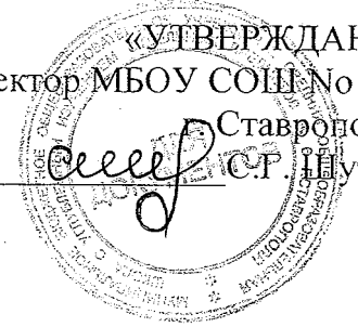
График проведения консультаций по подготовке к ГИА в 11 классах В 2018-2019 учебном году